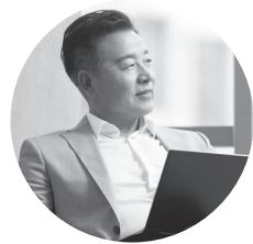
Lian, 50岁 教授

为您实现资产多样化，为财富创造快速的税惠增长，并保护遗产价值。此外，产生快速的投资回报，因为您的保单现金价值将在几年后超过所支付的累计保费。 随着时间推移，您的需求将不断调整，您也可以得益于灵活便捷的保险，实现某些财务策略。